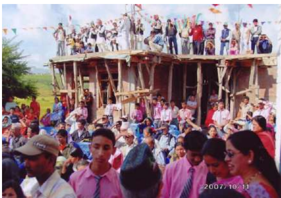
パドマ・パラカッシュ小学校の上棟式