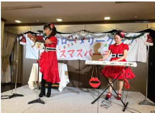
世界一の口笛奏者 レッドベゴーズ