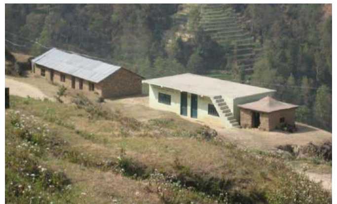
マヘンドララストリヤ小学校山の上の新校舎