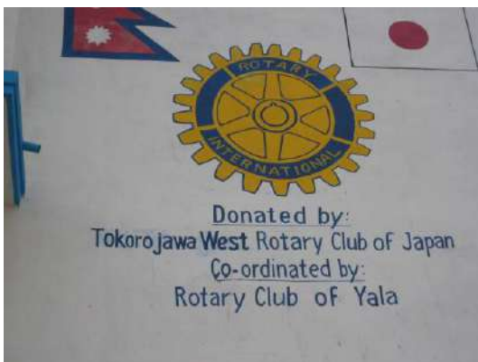
冠名プレートも「ところじゃわ」は、ご愛嬌