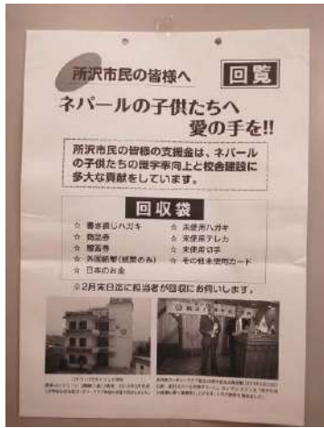
書き損じ葉書回収袋