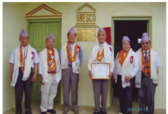
開校式に遠路参加