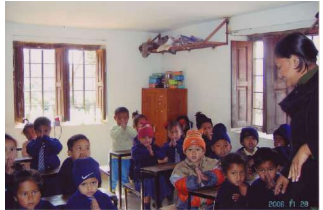
ネパールの子どもたちの純粋な目