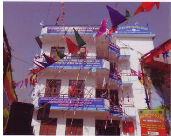
パドマ・パラカッシュ小学校の外観