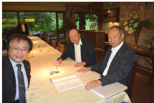
🌸 奉仕プロジェクト委員会