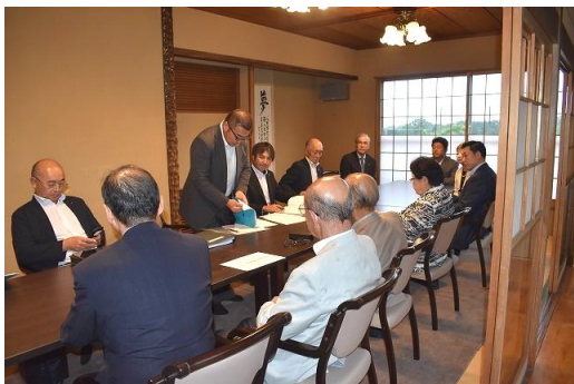
🌸 クラブ管理運営委員会