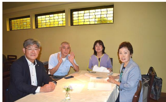
🌸 財団・米山委員会