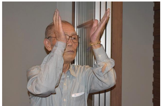
*こだわり 中締め 上野パサ会長