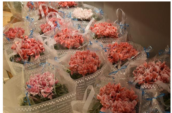
❁ どれにしよう。深紅 ピンク 白