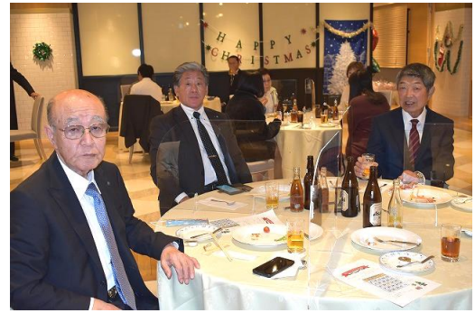
🌸 パス会長の皆様 有難うございます