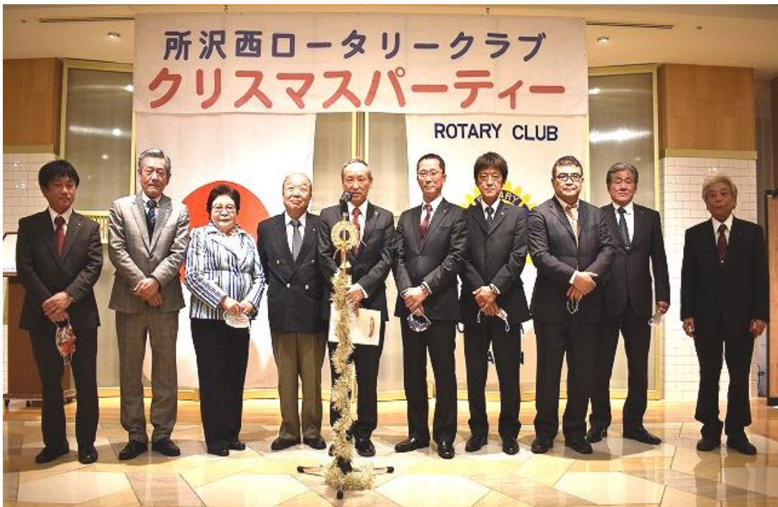
🌸 次年度役員・理事です。よろしく お願いいたします