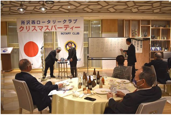
🌸 ビンゴ大会 お願い ビンゴになる数字出して〜〜